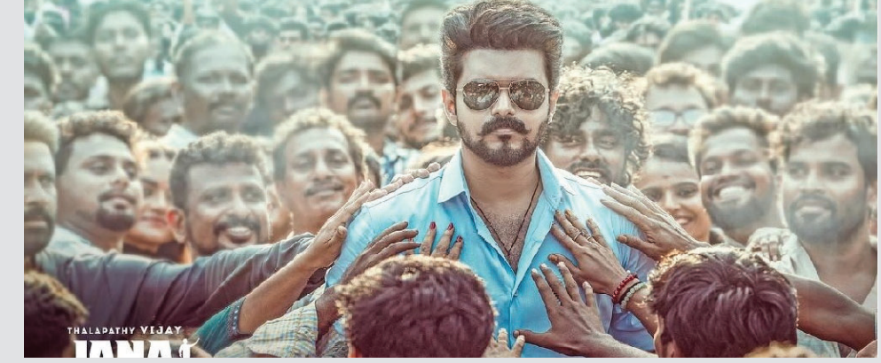
మొదట సంక్రాంతి కాసుకగా జనవరిలో విడుదల కావాల్సిన ఈ చిత్రం, సెన్సార్ సర్టిఫికేట్ రాకపోవడంతో ఆగిపోయింది. ఆ తర్వాత ఫిబ్రవరిలో రిలీజ్ చేయాలనుకున్నా, ప్రస్తుతం సినిమా రివైజింగ్ కమిటీ

రాజకీయాల్లోకి ఎంట్రి ఇచ్చిన నటుడు విజయ్ సినిమాలకు స్పెషియల్ చెప్పిన విషయం తెలిసిందే. నటుడిగా ఆయన ఆఖరి చిత్రం కావడంతో జననాయగన్ పై భారీ అంచనాలు నెలకొన్నాయి. అయితే, సెన్సార్ అభ్యంతరాల కారణంగా ఈ సినిమా విడుదల పడే పదే వాయిదా పడుతోంది. ఈ నెలలో జననాయగన్ థియేటర్లలో సందడి చేస్తుందని భావించిన అభిమానులకు మరోసారి నిరాశే ఎదురైంది. తాజాగా డీని రిలీజ్ కు సంబంధించిన ఓ వార్త సోషల్ మీడియాలో వైరల్ గా మారింది. న్యాయపరమైన చిక్కులు వీడితే విజయ్ పుట్టినరోజు కాసుకగా జూన్ లో జననాయగన్ విడుదలయ్యే అవకాశం కనిపిస్తోంది.